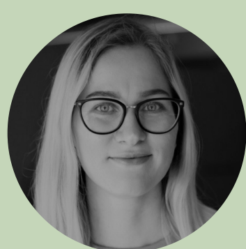
Mariel Luuk Loovjuhtimine, keskkonnateadus